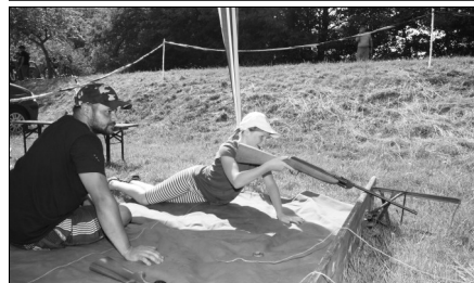
Střílelo se i ze vzduchovky