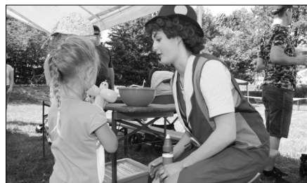
Oblíbený byl i balónkový klaun