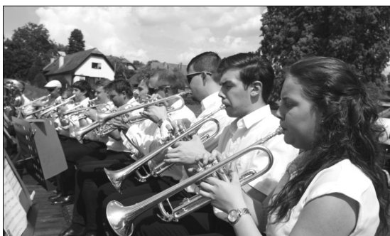
Vystoupení dechového orchestru Malá Haná

vatou. Hasiči si připravili soutěž ve střelbě ze vzduchovky a srážení terče vodní džberovou stříkačkou tzv. "džberovkou".