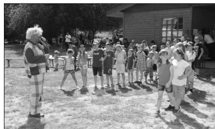
Děti soutěžily s klaunem