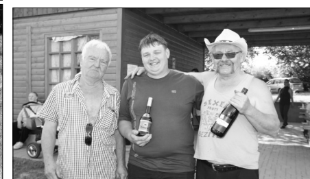
Nejlepší střelci z dospělých