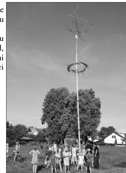
V závěru se skácela májka