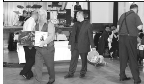
Výherce jedné z hlavních cen - vysavače