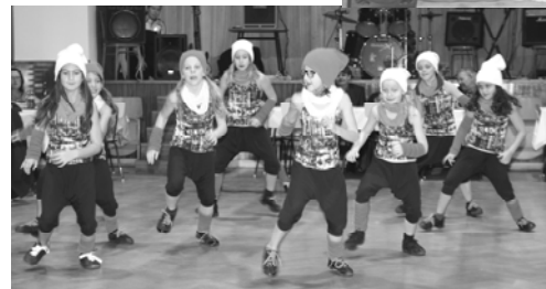
Malé tanečnice souboru