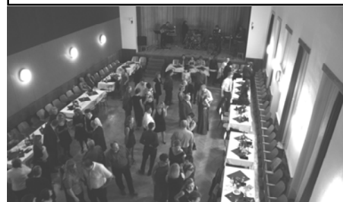
Netradiční pohled z nové galerie