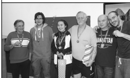
Nejlepší hráči ve čtyřhře

- pro amatéry, registrované, ženy i děti. Rok 2017 zakončili sportovci 28. prosince, kdy se celý areál kulturního domu v Líšnici proměnil ve velikou hernu. Na čtyřech stolech se utkalo ve svých kategoriích celkem 36 hráčů, kteří byli rozlosováni do skupin a v nich se utkali vzájemně mezi sebou. Ti nejlepší potom postoupili do vyřazovacích soubojů.