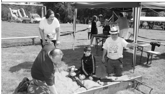
Soutěž ve střelbě ze vzduchovky

Děti již tradičně mohou oslavit svůj svátek na líšnickém hřišti, kde je Dne dětí spojována s kácením májky. Nebylo tomu jinak ani letos. Líšničtí hasiči připravili areál, vzali si za své občerstvení pro všechny návštěvníky.