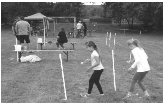
Hry pro děti