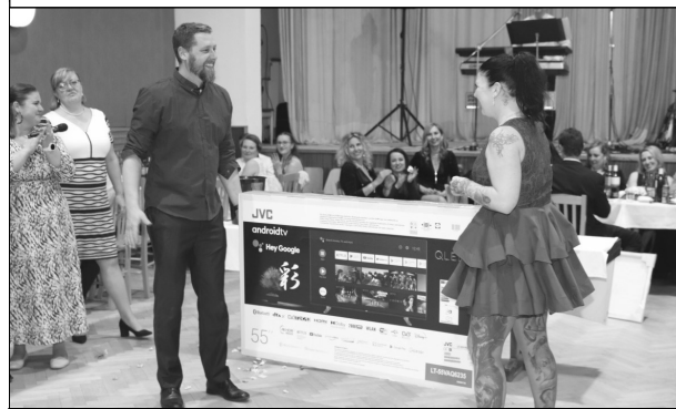
Šťastní výherci 1. ceny - televizoru

Ještě den před plesem se montoval nábytek, dokončovaly poslední úpravy a uklízelo se.