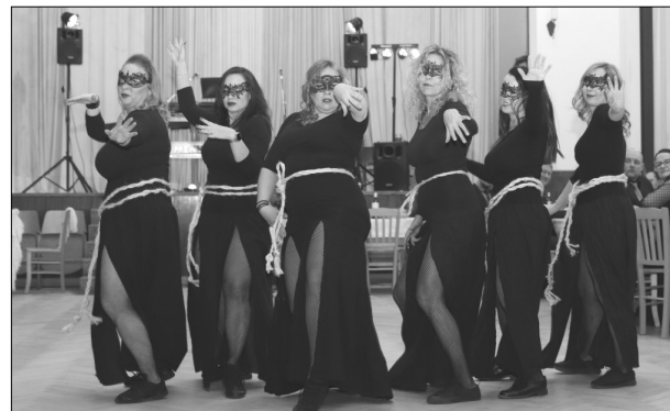
Taneční skupina Humanic Dance

Variabilní symbol Vyšehorky: 2xx - kde xx znamená číslo popisné Vašeho domu