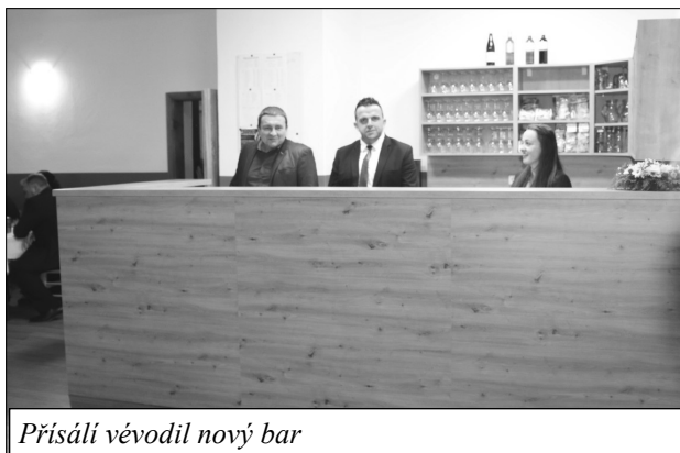
Prísáli vévodil nový bar

-schodek mezi přísálím a sociálním zařízením, zmizel plynový kotel, objevily se nové záchody a umyvadla, přibyl i přebalovací pult. Obklady a dlažby v příjemných barvách celé dílo jen dotvořily. V přísáli zmizelo obložení, změnil se nevyhovující pult baru, přibyla myčka nádobí a lednice. Také podlaha dostala slušivý povrch.