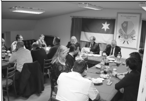
Přítomní vyslechli zprávy o činnosti SDH