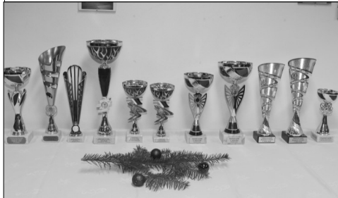
Do sbírky přibýlo 11 pohárů ze soutěží

upíjela. Byl silný a sladký. Kochala se tím nádherným vánočním stromem, u kterého stála a dívala se, jak září.