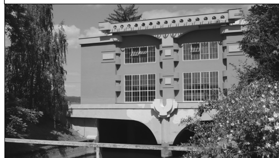
Vodní elektrárna na náhonu řeky Moravy

Každý obecní stánek reprezentoval jedno ekologické téma. A tak se někde třídil a recykloval odpad, jinde se zaměřili na udržení vody v krajině, obnovitelné zdroje energie nebo ochranu rostlin a živočichů. Pro návštěvníky byla organizátory připravena prohlídka vodní elektrárny - národní technické památky a Plhákovy vily v Háji, v Třeštině potom kostel sv. Antonína Paduánského a opravené věžní hodiny nebo bioplynová stanice patřící firmě ÚSOVSKO.A.S. Vyhodnotila se také soutěž škol a školek ve skládání obecních znaků z odpadového materiálu, starostové soutěžili v řezání dřeva ruční pilou. Představili se třeštinští mladí hasiči, vystoupily děti z mateřské školy, zhlédli jsme malou středověkou bitvu v podání Mohelnické sebranky. Hudbou příjemňovala den Postřelmovská dechovka a folková skupina MADALEN. Večer patřil taneční zábavě se skupinou HERRGOTT. Bohatě občerstvení pro všechny připravili hasiči, myslivci a sokolí. Asi tisícovka spokojených návštěvníků tak strávila v Třeštině krásný prosluněný den. Znovu jsme se přesvědčili o tom, že se naše obce mají čím pochlubit. Takže za rok na shledanou mezi sousedy v Mohelnici!