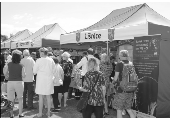
Stánek naší obce byl stále v zájmu návštěvníků