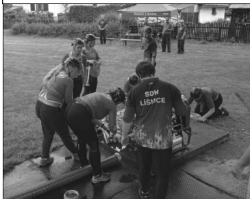
Příprava na soutěž