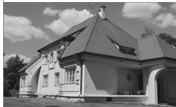
Prvorepubliková vila v Háji