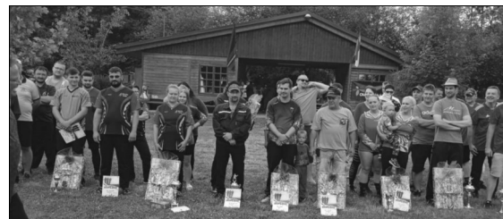
Nastoupená družstva při vyhlášení výsledků

A když už bylo na hřišti živo od rána, škoda nevyužít připraveného zázemi a občerstvení. Ve 14.30 hodin se po přestávce na občerstvení vyhlásily výsledky soutěže a celé dopoledne se plynule přesunulo do neformálního posezení a malého programu pro děti. Na louce se vztyčil skákací hrad a skluzavka, které byly tři hodiny