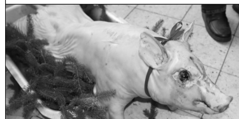
Na vítěze čekala hodnotná cena