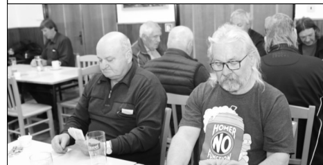
Nechyběli ani domácí borci