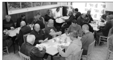
Hráči zaplnili přísáli KD