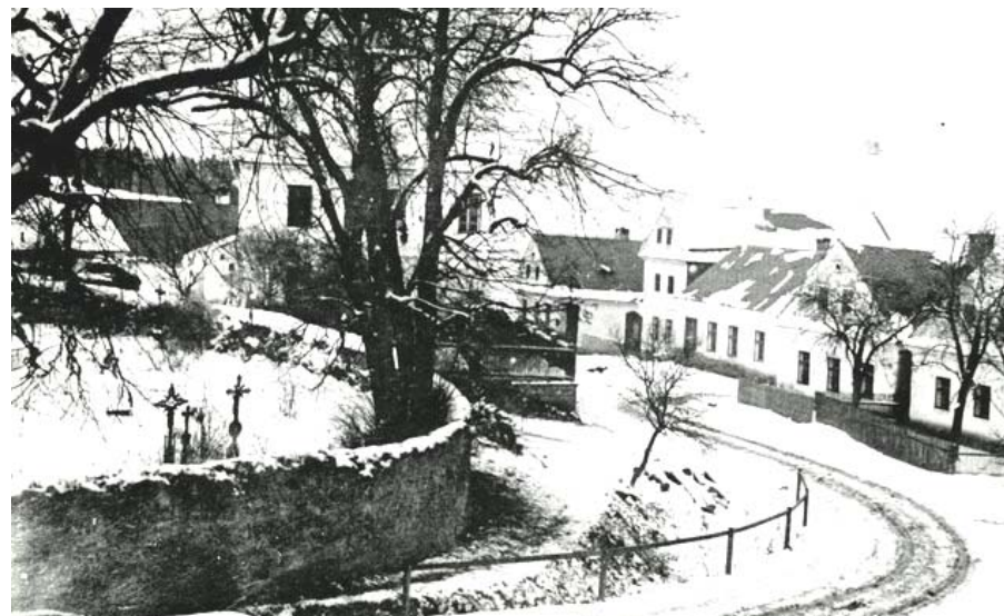
Historický snímek pochází z Vyšehorek a znázorňuje zatáčku pod farou, vlevo kamenná zídka kolem kostelíka, u které jsou patrné i kříže. V pozadí budova bývalé školy. Je ten rok nám opět chybí. Troufne si někdo hádat?