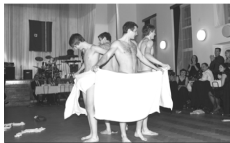
Vystoupení domácích Lišáků