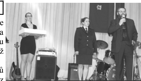
Předávání symbolického klíče

velké množství cen do tomboly. A tak se v tombole objevilo 110 cen jako přímé výhry, dalších asi 50 cen v půlnočním slosování a také 8 cen na vstupenku. Mezi cenami se objevila drobná elektronika - varné konvice, toustovače, topinkovač, fěn, mixér, ale i vysavač. Vše doplňovaly dárkové balíčky, uzeninové balíčky, tvarůžkové balíčky, autokosmetika, drogerie, brambory, zubní hygiena, brikety ale třeba i dárkové poukazy na masáže, do fotoateliéru, vstupenky do muzeí či na hrad Bouzov. Hlavní cena selátko vepřika domácího našla svého majitele v naší obci a to na Vyšehorkách. K jídlu se podával vepřový či kuřecí řízek s bramborovým salátem, hovězí gulášek či tlačěnka. Za barem byla klasická nabídka v čele s medovinou. Vin-