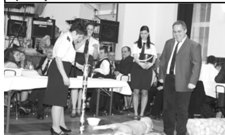
Šťastný výherce 1. ceny

nému lístku už několik let zcela vládne víno bílé. Stejně tak i "sladřáky" Jelcina převládají před klasickou bílou i hořkou lihovinou. A rum s kofolou je klasika už spoustu let. Mezi hosty plesu jsme kromě kolegů hasičů z okrsku mohli potkat i hasiče z Vranové Lhoty, ale třeba i pana Dostála,