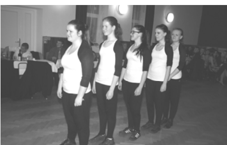
Tanečnice z DDM Mohelnice

O kulturní vystoupení se postaraly dva vstupy - prvním bylo vystoupení děvčat