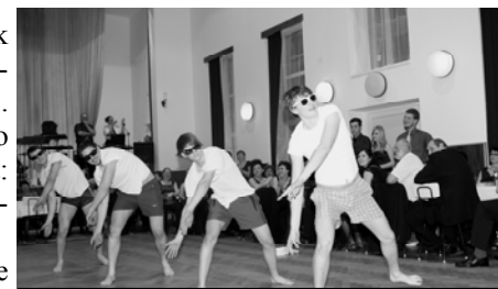
Vystoupení domácích Lišáků

jen nevíme, co si připraví na ten rok příští, neboť vystoupení zakončené strip-týzem se už asi ničím překonávat nedá ... Pro slabší povahy - vystoupení nebylo úplně "light" - musím na ně prozradit: lišáci, když viděli ten plný sál lidí, vystupovali ve zdařilých kostýmech ... Díky velké zásluze našeho pokladníka se letos podařilo nastřádat nějaký ten finanční příspěvek od sponzorů a také