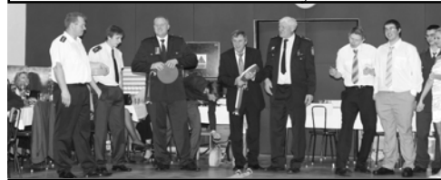
Soutěž v hodu hadicí na cíl

soutěží v hodu hadicí na cíl si i letos našlo své příznivce. Ti kdo trefili cíl, si donesli i nějakou tu lahvinku. Letos se hod na cíl povedl i zcela nečekaně - jeden ze soutěžících si sám pulsíčkou od hadice rozrazil nos. Nejen o něj se ale zcela perfektně postarala pořádková služba plesu, a tak bylo vše ošetřeno, a tak vlastně i zkontrolováno vybavení lékárničky na kulturním domě. O půlnoci se losovala klasická tombola a také pět šťastných majitelů vstupenek, kteří obdrželi nějakou tu dobrotu - sladké dorty, aspikový dort či uzeninový balíček. Hosté byli mile překvapeni novým vzhledem sálu a postupně se střídali na balkoně v prvním patře,