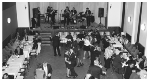
Pohled z balkónu na tanečnický

V sobotu 31. ledna 2015 se konal další z plesů hasičů okrsku č.10. Ples to byl více než vydařený - návštěvníků se sešlo více než loni, v tombole bylo přes 80 pěkných cen a celý ples měl tu správnou přátelskou atmosféru. Pochvalu s velkým P si zaslouží místní kapela S-band Líšnice, která si nemohla stěžovat na prázdný parket již od první písničky. A tak nám všem hostům hrála až do pozdních ranních hodin a taneční parket byl vždy plný. Tradiční vyplnění přestávek